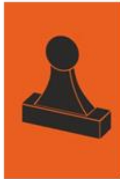
Zelfstempelaar (RC) Bemante (RC)