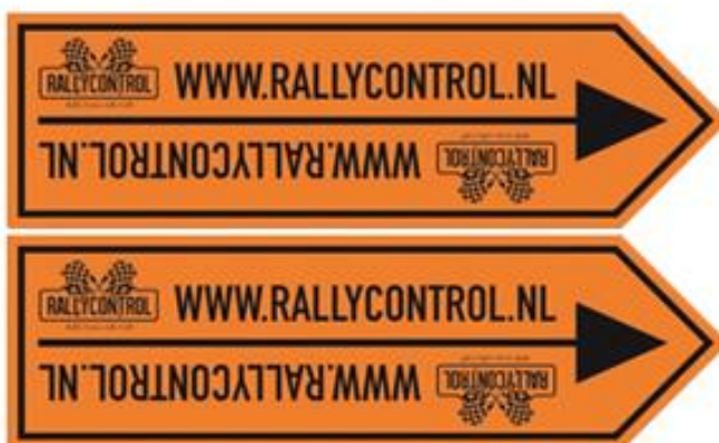
Dubbele pijl - einde omleiding / routerichting