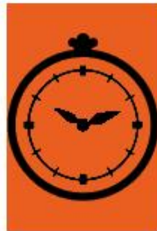
Tijdcontrole (TC) Tijdwisselcontrole (TWC)