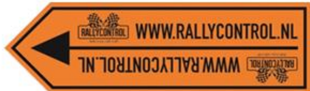
Dwangpijl (routerichting of omleiding)