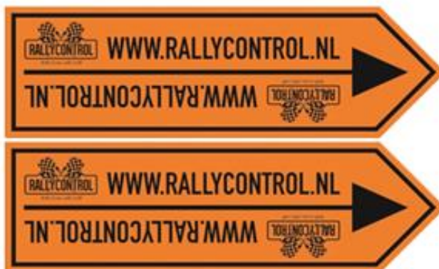
Dubbele pijl - einde omleiding / routerichting