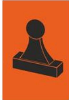
Zelfstempelaar (RC) Bemane (RC)